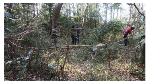
秘密基地をつくりました