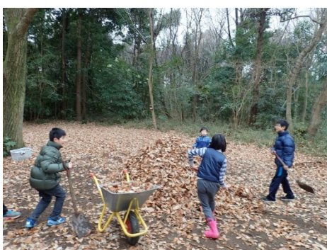
落ち葉を集めて大きなベッドを作りました

◇森の中で様々なアクティビティを行います。スタッフの見守りの下、ひとりで活動できるお子さんを対象とさせていただきます。